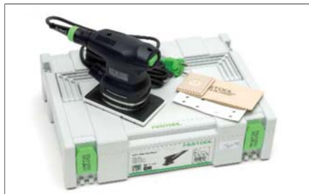
Bruska vibrační malá