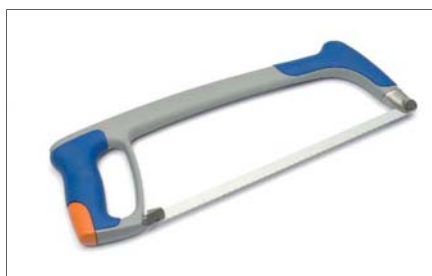
Pilka na kov