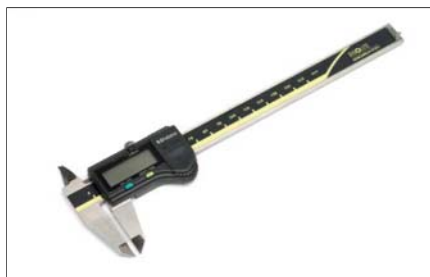
Měřítka posuvná digitální