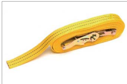
Popruh stahovací ráčnový