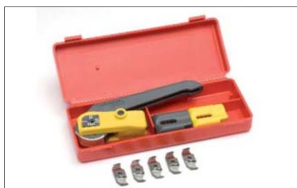
Nůž odplášťovací ráčnový