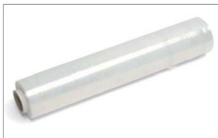
Fólie stahovací ochranná