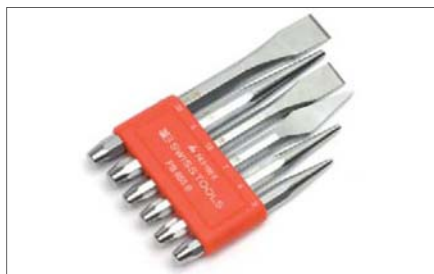
Sada sekáčů a průbojníků