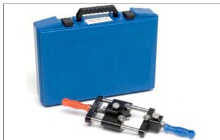
Ořezávač polovodivé vrstvy