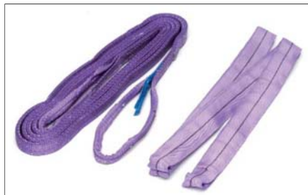
Popruh zvedací a smyčka závěsná