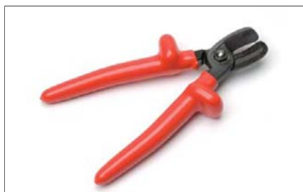
Nůžky kabelové malé