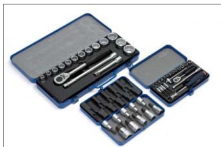
Ráčny a sady hlavic nástrčných