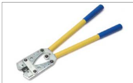
Kleště lisovací pákové