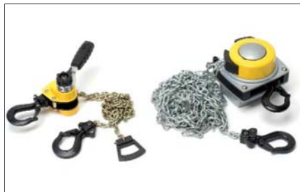
Napínák a kladkostroj řetězový