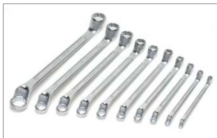
Sada klíčů očkových