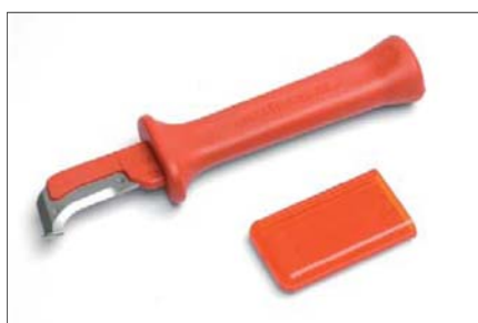
Nůž kabelový s botkou