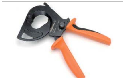
Nůžky ráčnové velké