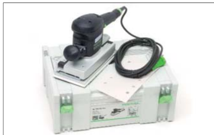
Bruska vibrační velká