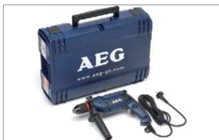
Vrtačka elektrická příklepová