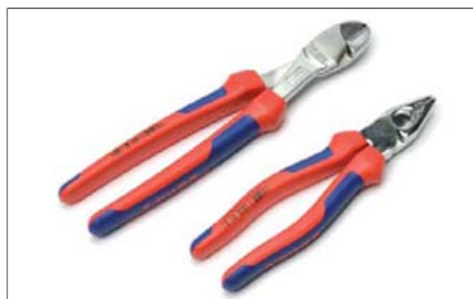
Kleště štípací stranové a kombinované